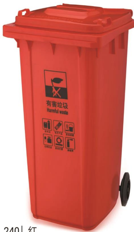
240 L 红