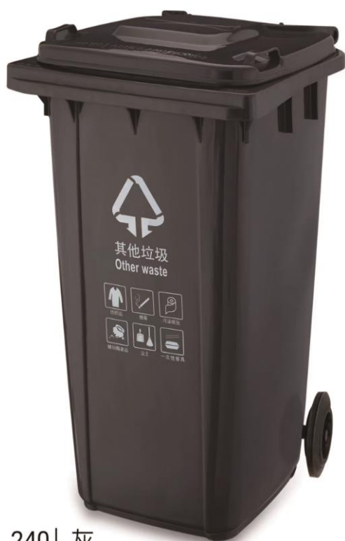
240 L 灰