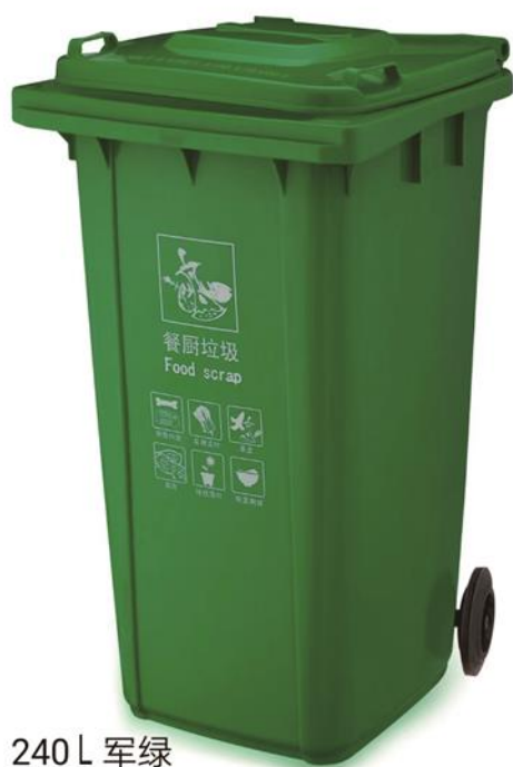
240 L 军绿