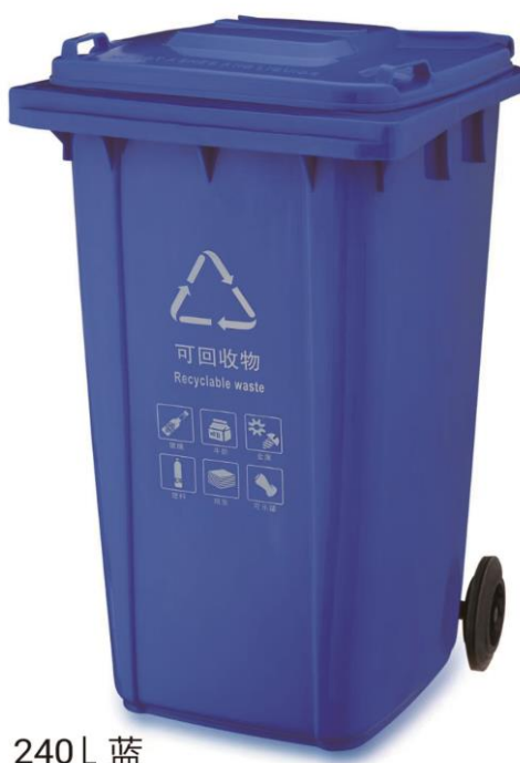
240 L 蓝